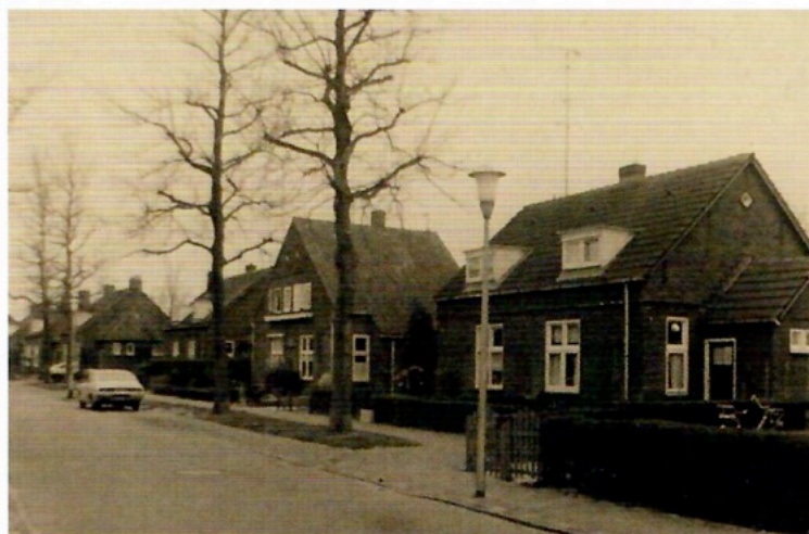
De straat in de jaren zeventig

gezonde leefomgeving voor arbeiders, net buiten de stad. Kortom, een soort villawijk voor arbeiders.