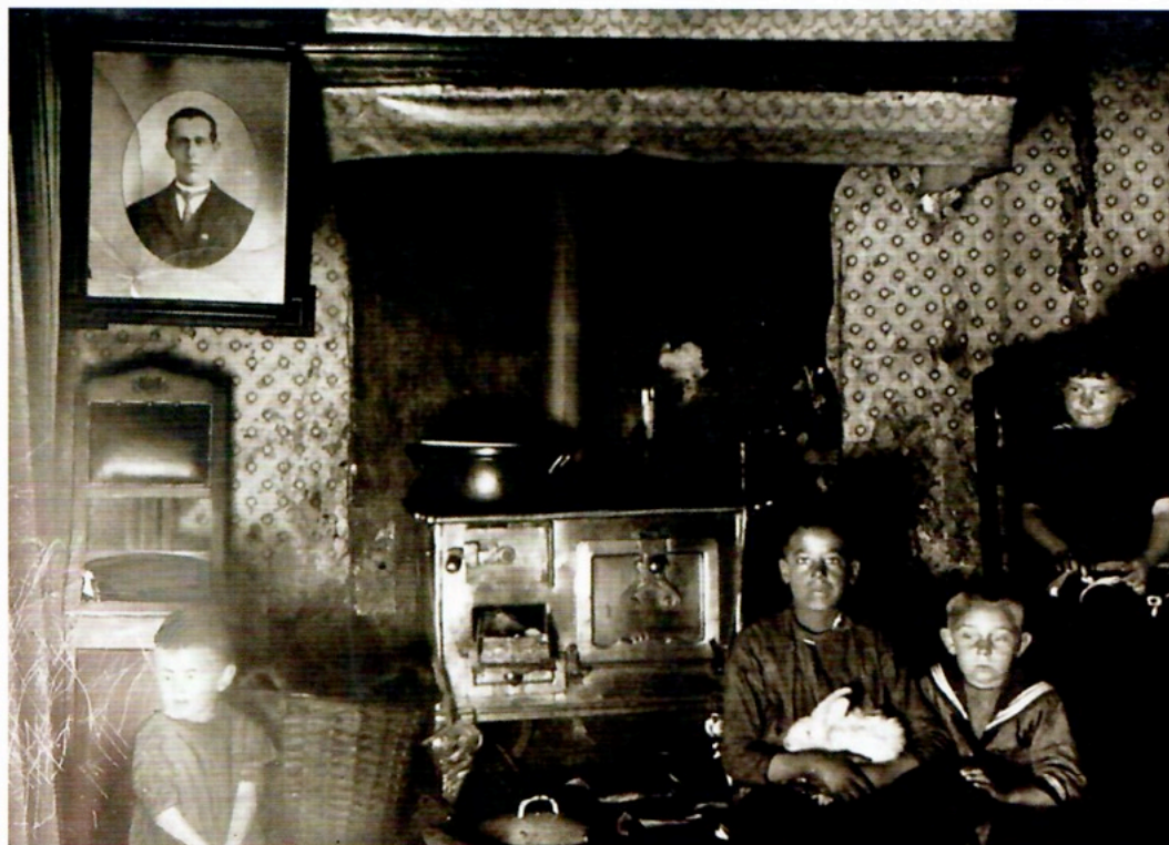
De krotten van Naarden. In deze vervallen kamer (St. Annastraat 16) woonde een gezin van tien

De Woningwet legde de basis voor rijk en gemeente om woningbouwverenigingen financieel te ondersteunen. Hiermee ontstond een nieuw type vereniging, gericht op verbetering van de volkshuisvesting. Door subsidies en goedkope leningen moest de bouw van relatief dure huurwoningen (die immers aan allerlei eisen moesten voldoen) rendabel worden gemaakt.