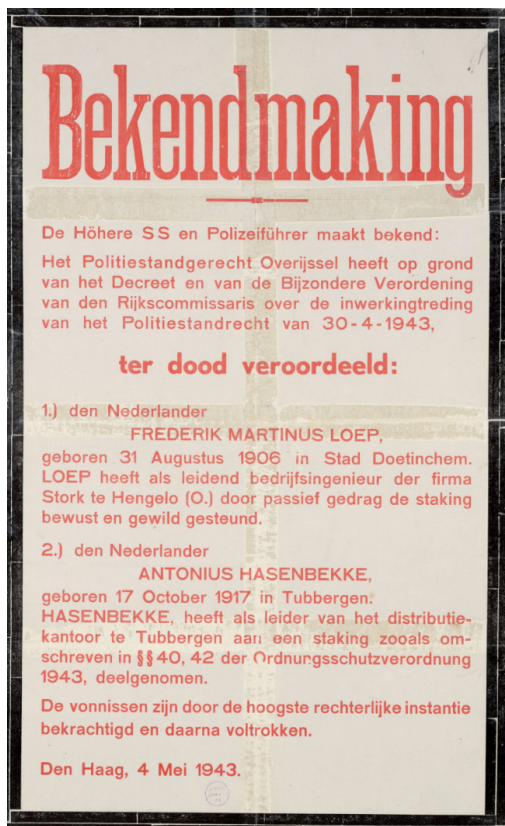
Aanplakbiljet met bekendmaking doodvonnissen vanwege deelname aan een staking en vanwege passief gedrag.

vrijgelaten, ook de twee die vanwege overtreding van het standrecht waren opgepakt. Dit was tegen de Duitse instructies en vooral de laatste twee mochten hiermee, gezien de zware sancties (doodstraf), van geluk spreken.